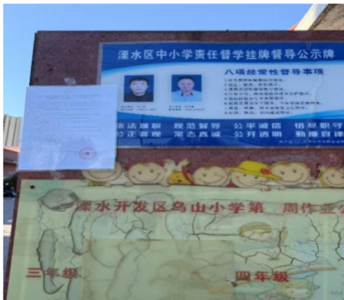
溧水开发区乌山小学