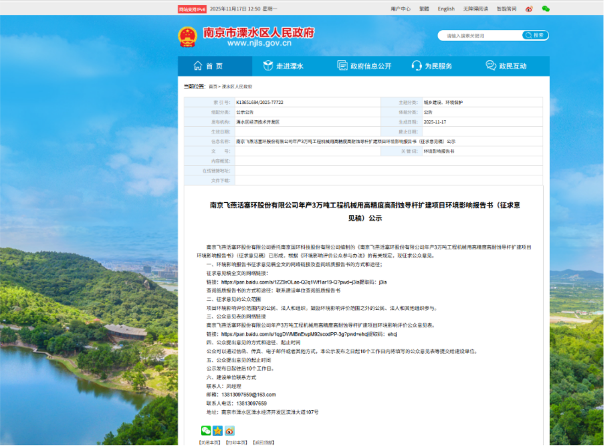
图 3-1 征求意见稿网络公示情况

根据《环境影响评价公众参与办法》（生态环境部令第4号）中第十一条要求，项目征求意见稿可通过在建设项目所在地公众易于知悉的场所张贴公告的方式公开，且持续公开期限不得少于10个工作日。