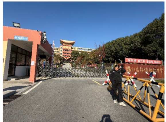
溧水区柘塘初级中学