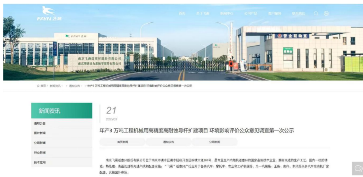
图 2-1 环境影响评价第一次公示网络截图

本项目于2025年3月21日在南京飞燕活塞环股份有限公司（ http://www.feiyancn.com/about.html ）进行了第一次公示网络公示，其公示载体与《环境影响评价公众参与办法》相符合，公示情况见图2-1。