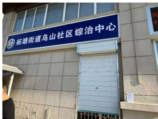
柘塘街道乌山社区