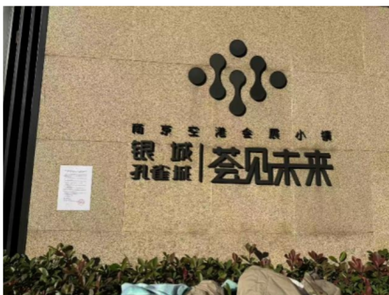
银城孔雀城荟见未来