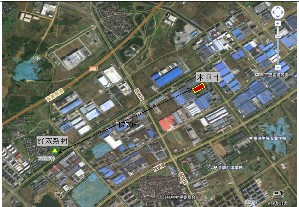
图 3-1 项目与大气环境质量引用监测点位位置关系