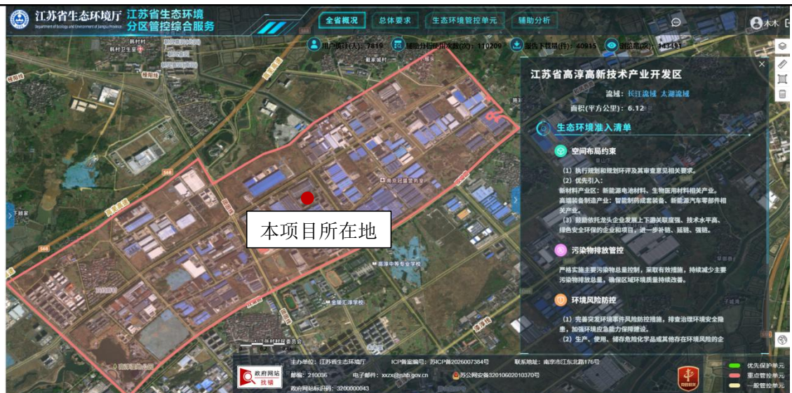
图1-1 项目与江苏省生态环境分区管控综合服务平台对照图