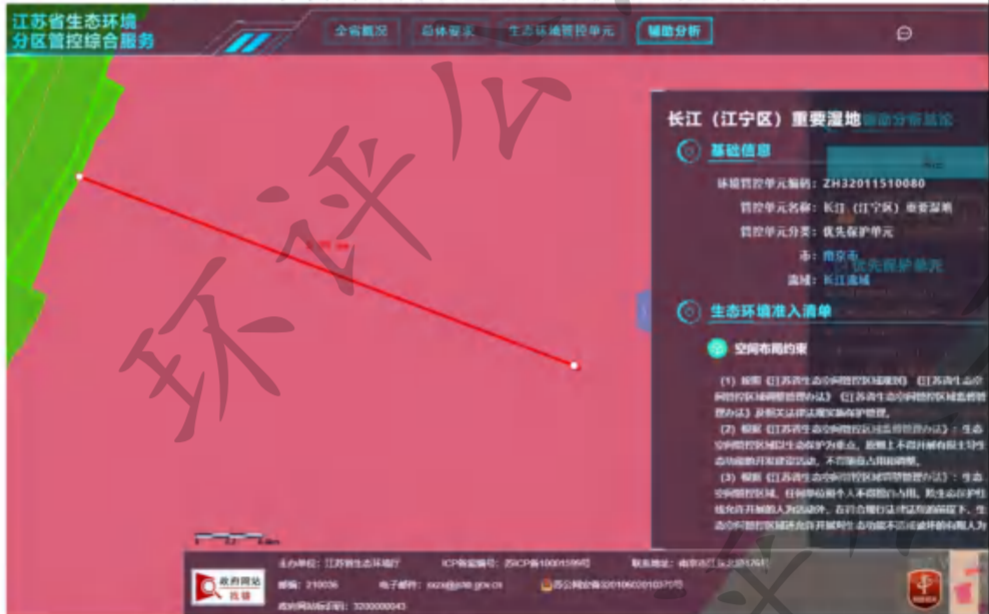
图 1-2 本项目距离最近生态空间管控区域查询截图

本项目建设不会导致区域生态空间保护区生态服务功能下降，不违背江苏省、南京市生态红线区域保护规划中的要求。