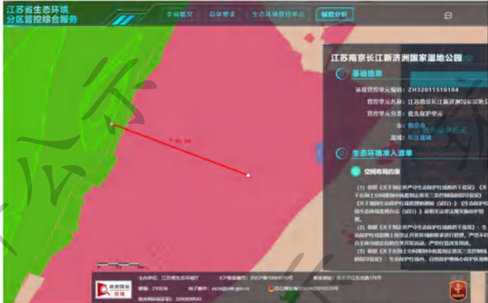
图 1-1 本项目距离最近生态保护红线查询截图