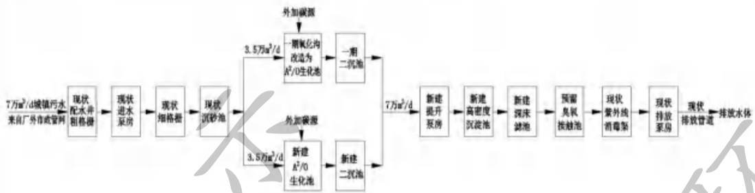
图 4-4 滨江污水处理厂工艺流程图

本项目建成后，综合废水接管至滨江污水处理厂集中处理，尾水最终排入江宁河，其可行性分析如下：